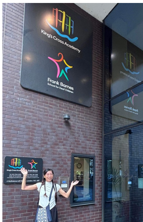
ロンドン フランク・バーネスろう学校

一方、カナダでは、音に依存しない新しい音楽のあり方が実践を調査しました。ろう者が主体となって運営する芸術教育の場では、「サイン・ミュージック」という音楽表現が用いられています。これは手話の言語的特性としての動きやリズムを通して音楽を構成するものです。音がなくても、身体や空間の変化によって音楽的な流れや感情が共有されます。また、ろう者独自の視覚を通じた文化や、さまざまな社会的な抑圧にかかるコンテキストから生み出された表現で、国籍や言語に関わらず共通認識を持つことができます。