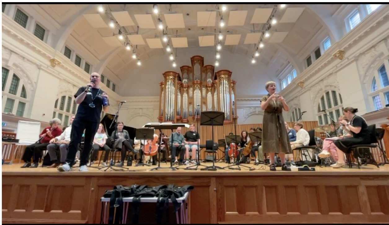
ロンドン 王立音楽学院で行われたインクルーシブコンサートの様子

音楽は本来、聴覚だけに限られるものではありません。さまざまな感覚を通して経験できるものです。聴覚に依らない音楽のあり方を認めることは、アクセシビリティの向上だけでなく、音楽そのものの可能性を広げることに繋がります。今後も、ろう者主体の実践を通して、多様な感性が尊重される文化芸術の環境づくりを目指し模索を続けていきたいと考えています。